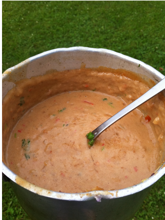
En saus på sin siste reise.

Som tidligere nevnt er jeg glad i ting som kan forberedes. Denne agurksalaten faller fint inn i denne kategorien.