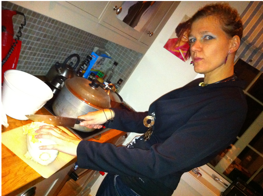
Bollefrua skjærer kinakål. Good times.