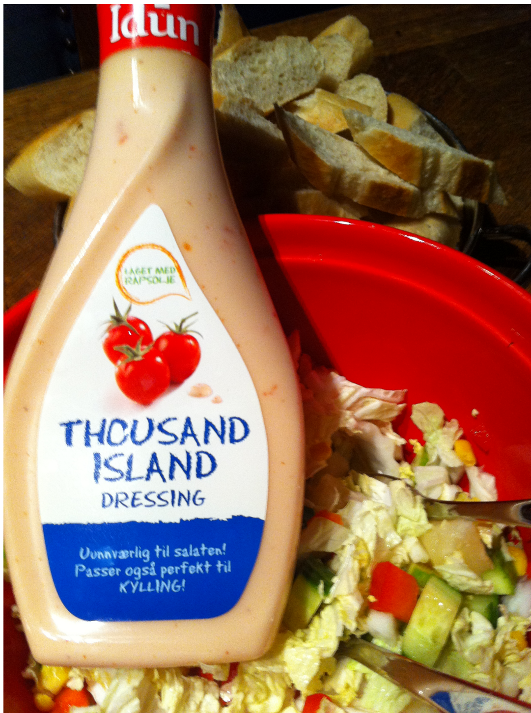
Ingen 80-tallsfest uten Thousand Island!