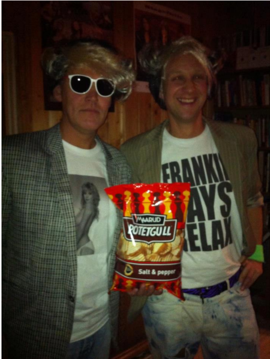
The pleasure dome-boys