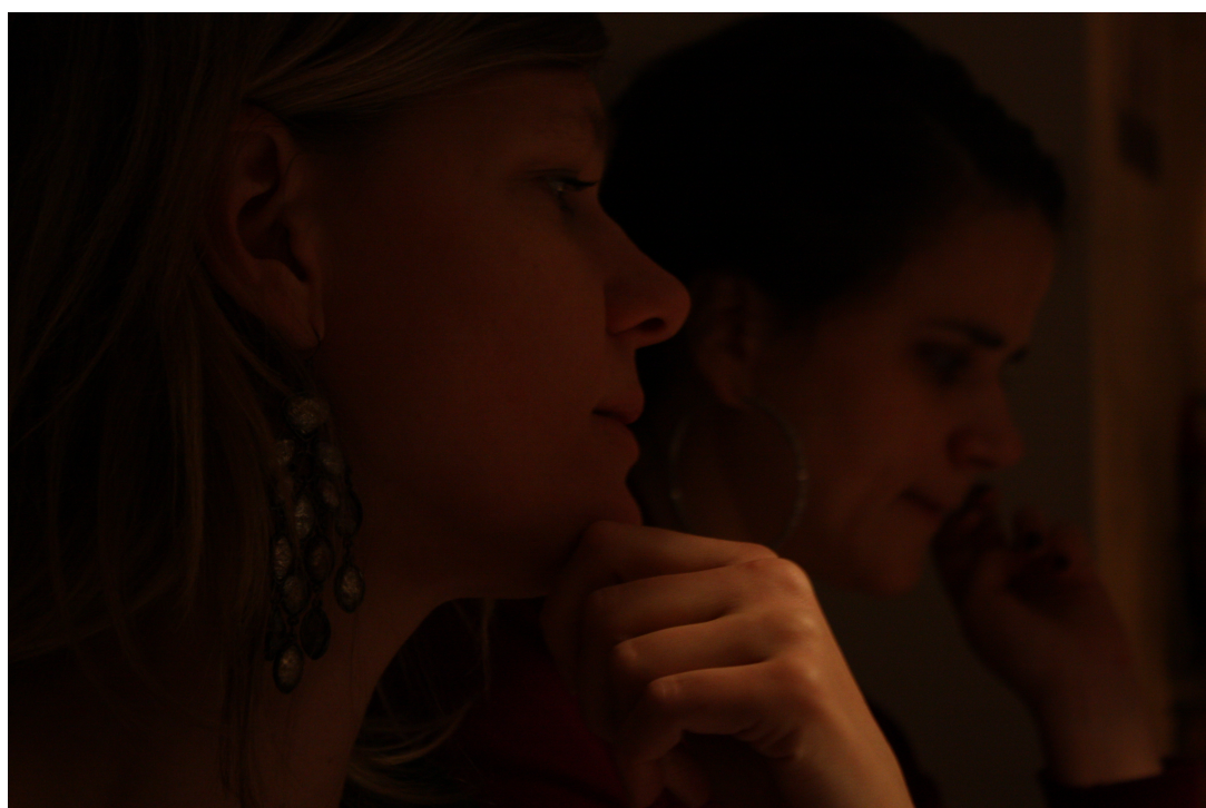
Bollefrua og venninnen hennes