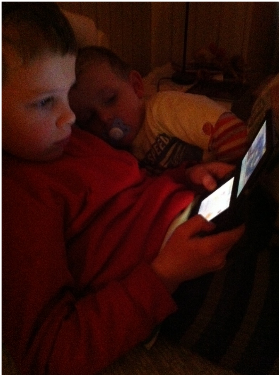
Syk lillebror (Beklager uklare bilder, kun iphone denne gangen)