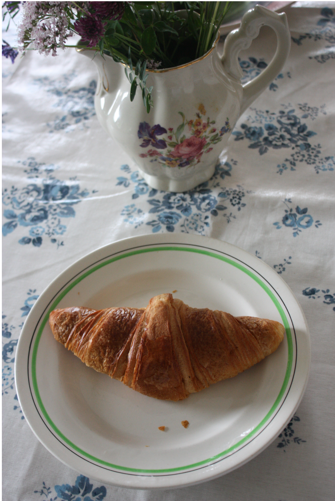
Frokost dag 2

Men så begynner idyllen å rakne. Morgenen etter våkner vi til dette været: