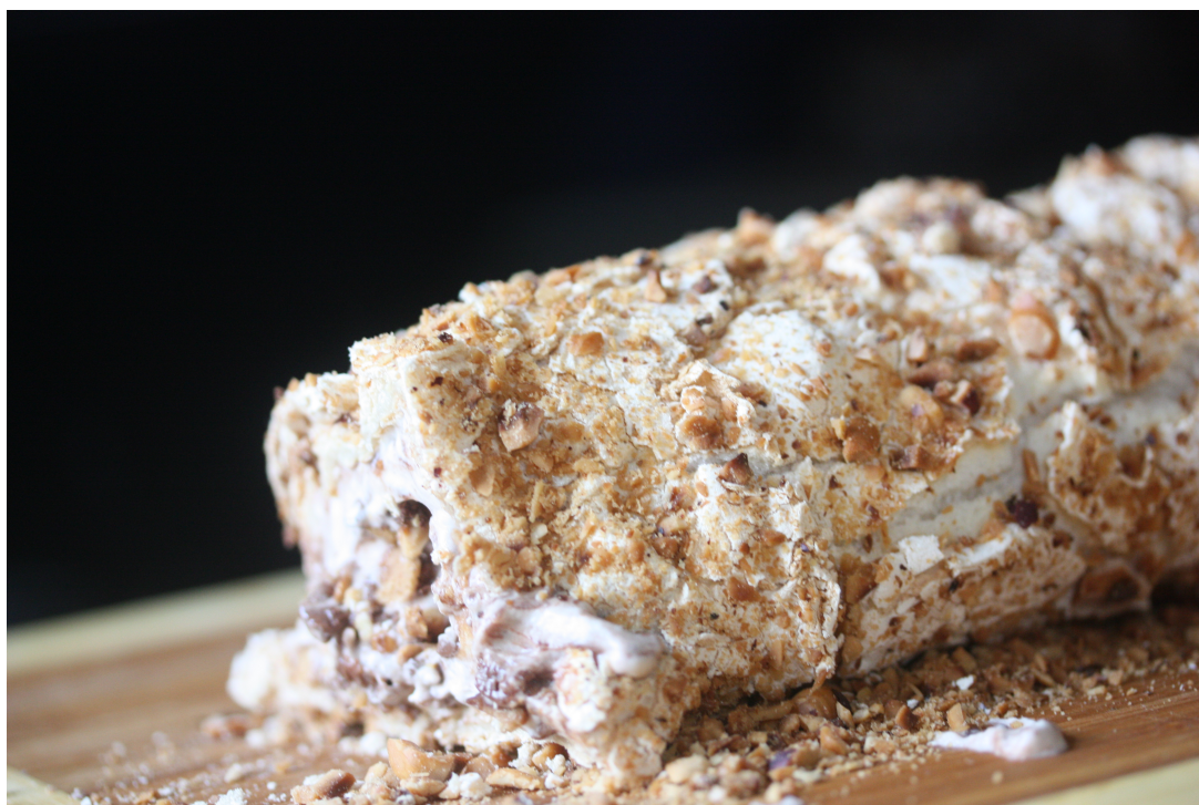
Marengsrullekake med hasselnøtter og nutellakrem