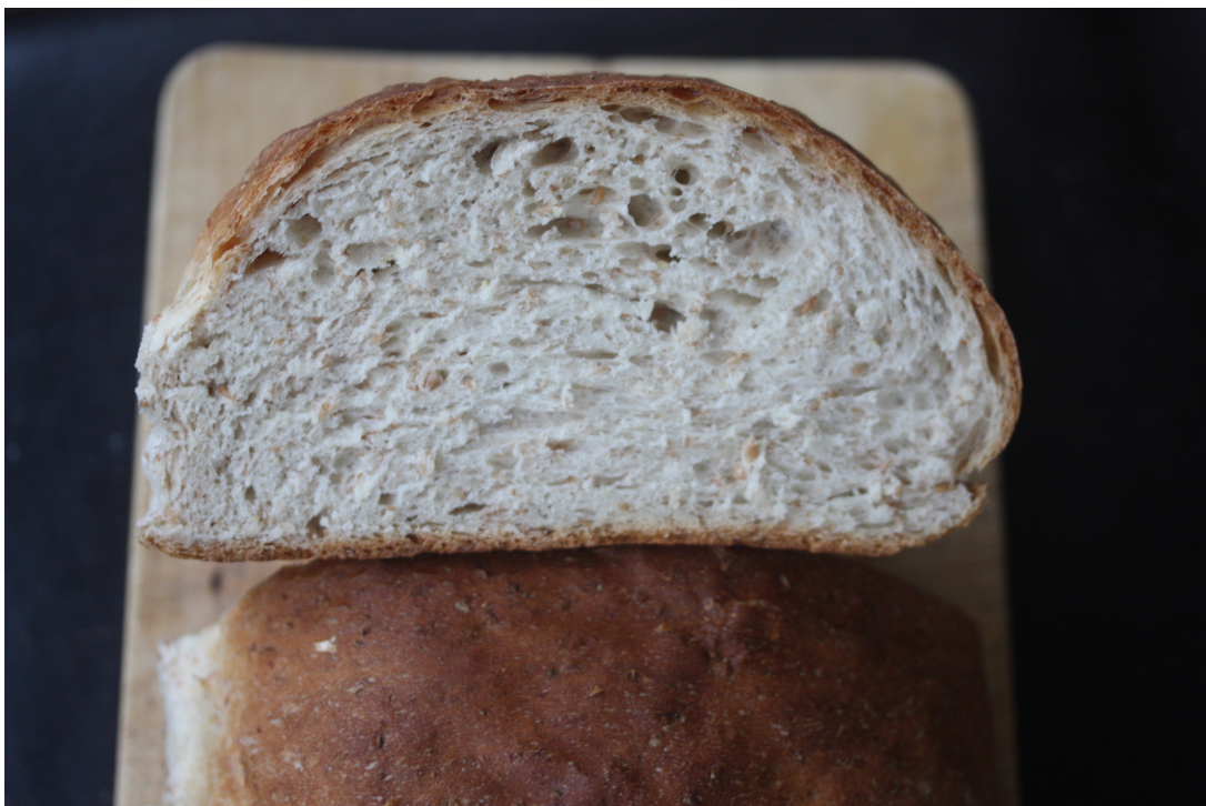
Det beste kneippbrødet! (Har blitt en gjenganger hos oss)