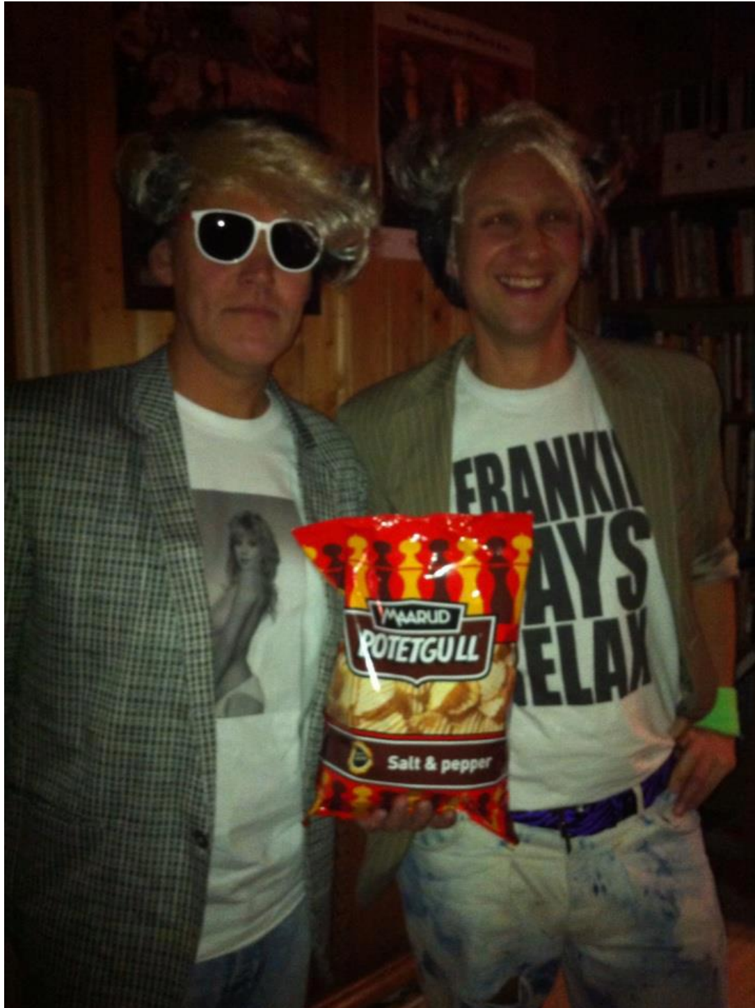
The pleasure dome-boys