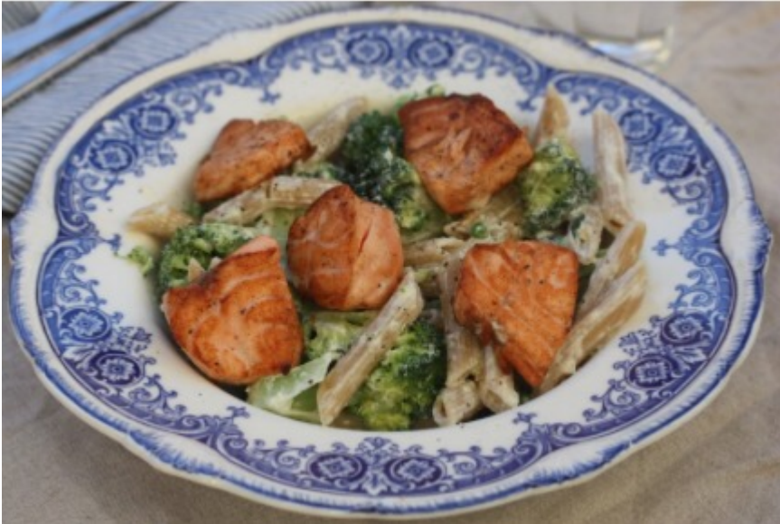
Kremet fullkornspasta med laks og brokkoli